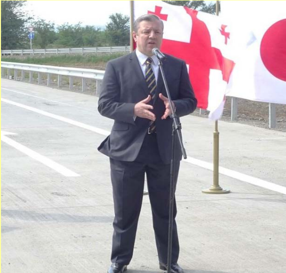
საქართველოს პრემიერ მინისტრის ბატონი გიორგი კვირიკაშვილის სიტყვა

პრემიერ მინისტრმა ბატონმა კვირიკაშვილმა გამოხატა თავისი ღრმა მადლიერება იაპონიის მიმართ მხარდაჭერისათვის და ხაზი გაუსვა აღნიშნული პროექტის მნიშვნელობას საქართველოს და მთელი რეგიონისათვის.