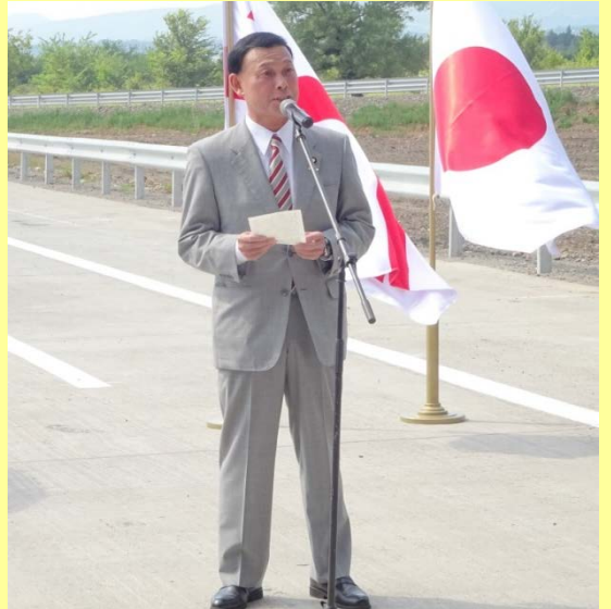
იაპონიის საგარეო საქმეთა ვიცე მინისტრის ბატონი მოტომე ტაკისავას სიტყვა